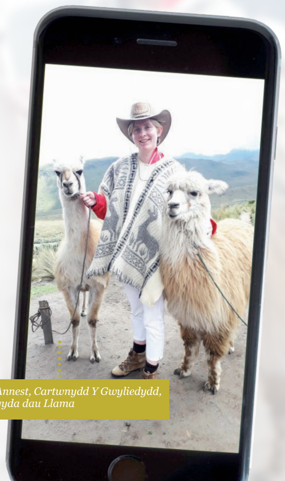
Annest, Cartwnydd Y Gwyliedydd, gyda dau Llama