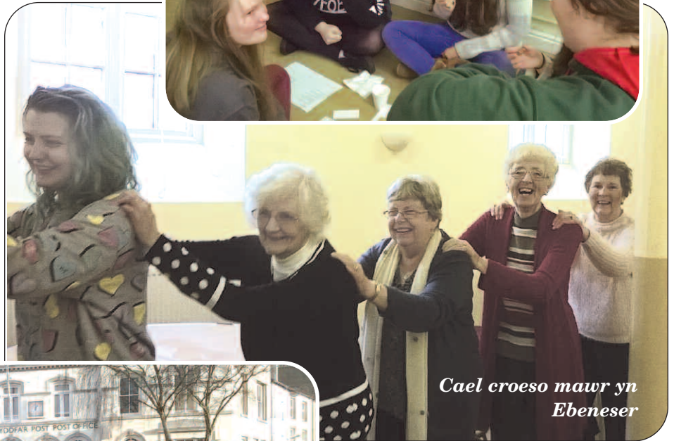
Cael croeso mawr yn Ebeneser