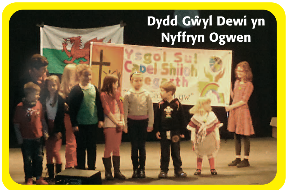
Dydd Gŵyl Dewi yn Nyffryn Ogwen