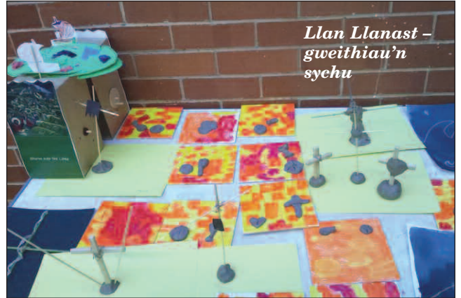
Llan Llanast - gweithiau'n sychu

Davies. Trwy'r digwyddiad hwn cyflwynwyd yr arddangosfa i gynulleidfa newydd yn cynnwys pobl o bob oed a chefnidir. Roedd gwahanol weithgareddau i alluogi pobl i ymateb yn greadigol i'r lluniau. Roedd cyfle i fodelu, paentio a chreu collage gan adlewyrchu arddulliau yn ogystal â thestunau'r lluniau. Yna cafodd pawb greu 'person' mewn paratoad at yr Addoliad, yn seiliedig ar y llun 'Y Pum Mil'.