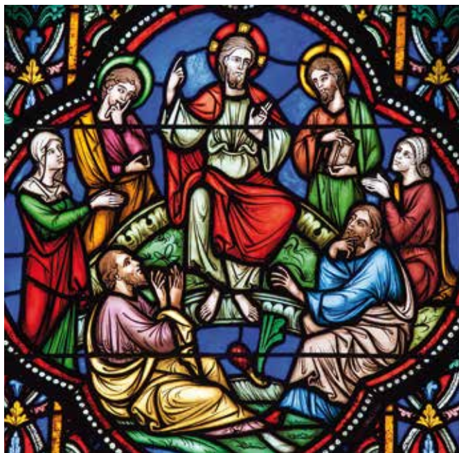
Y Bregeth ar y Mynydd